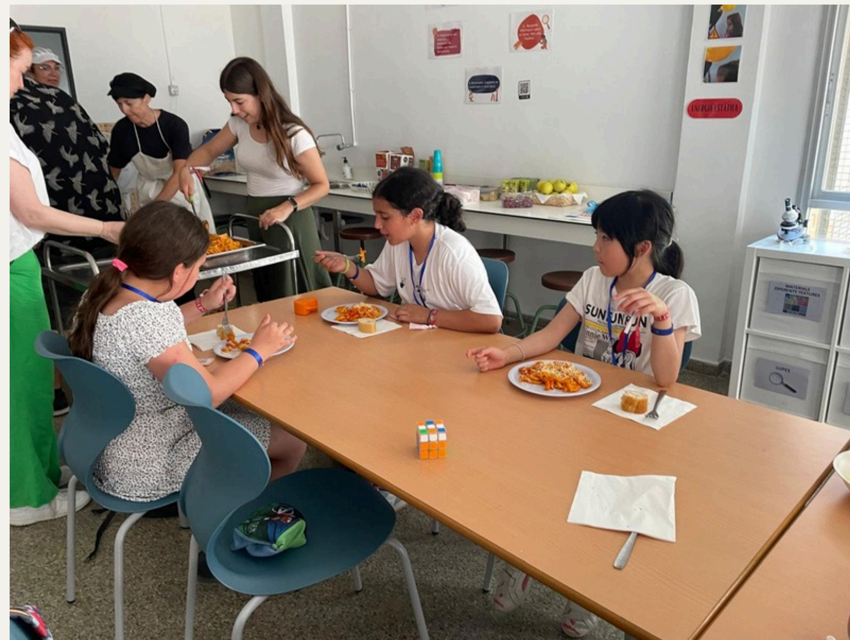
warmes Mittagessen im Chemieraum